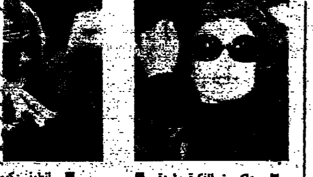
جكي : الفكرة واردة

مذ أيام قلية ، تبنى مجلس الوزراء الفرنسي مشروع قانون يتناول « الحماية الاجتماعية للكاتب »... لماذا لا تكون حماية اجتماعية للكاتب ؟